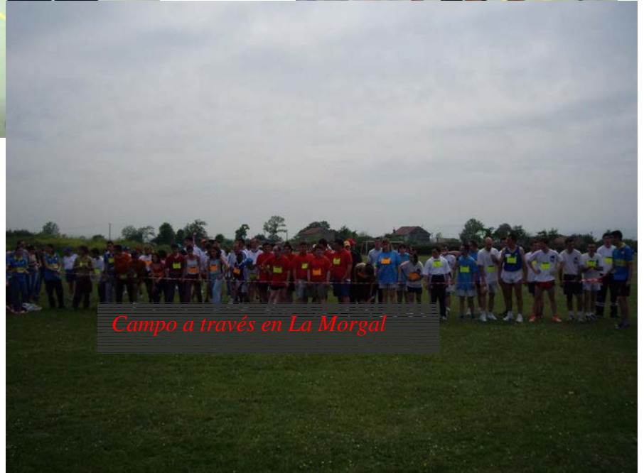
Campo a través en La Morgal