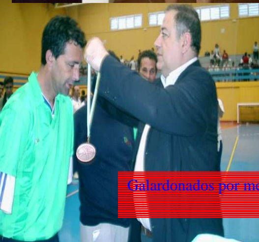
Galardonados por medalla a nivel nacional en 2005