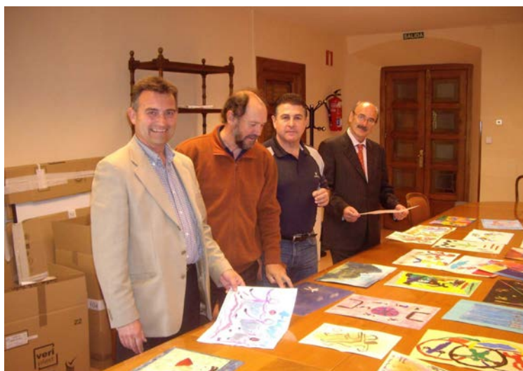
Jurado Concurso "Dibujo y Pintura Deporte Especial"