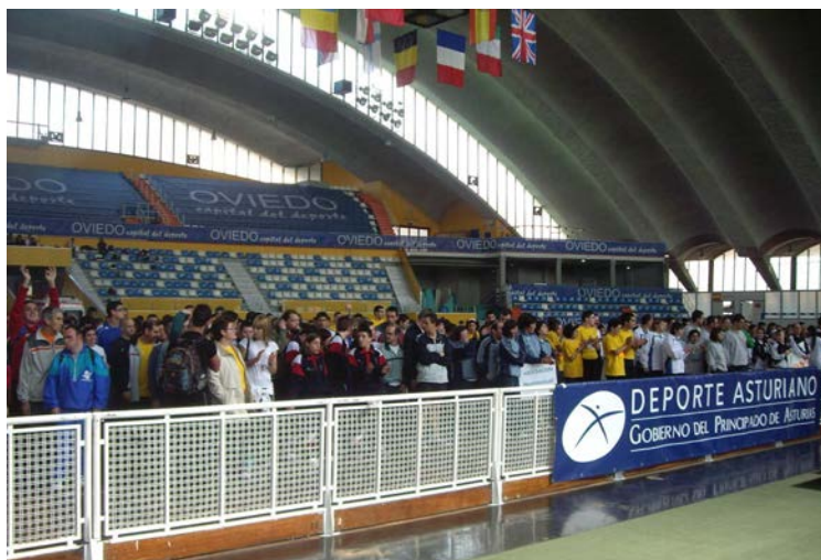
Juegos de Atletismo (Palacio Deportes-Oviedo)