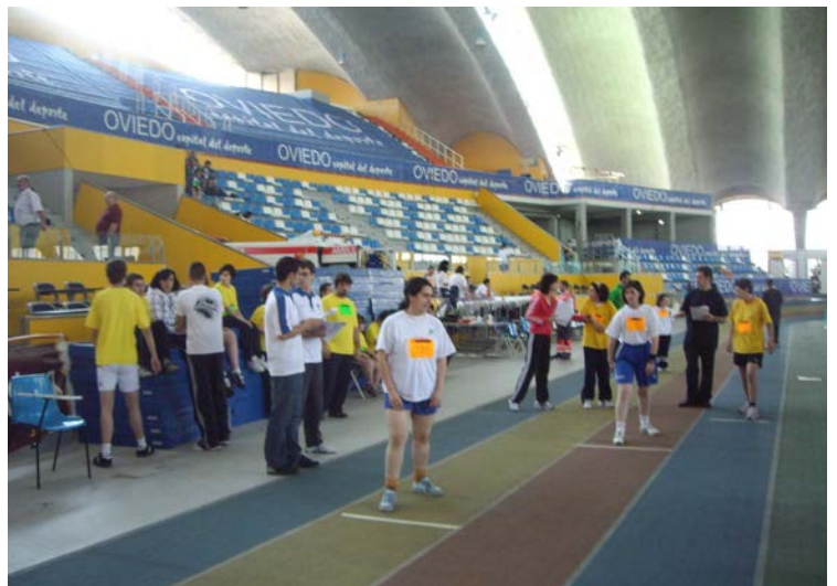
Juegos de Atletismo (Palacio Deportes-Oviedo)