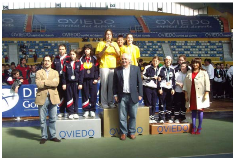
Autoridades en entrega premios (Oviedo)