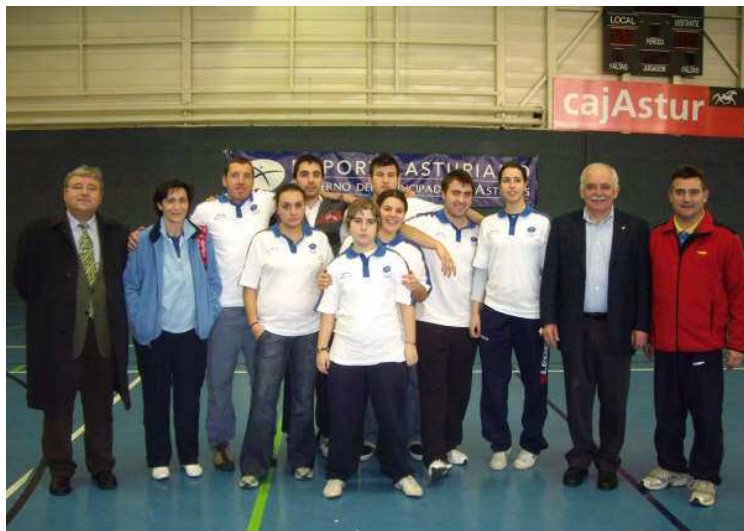
Alumnos IES Alfonso II (TAFAD)