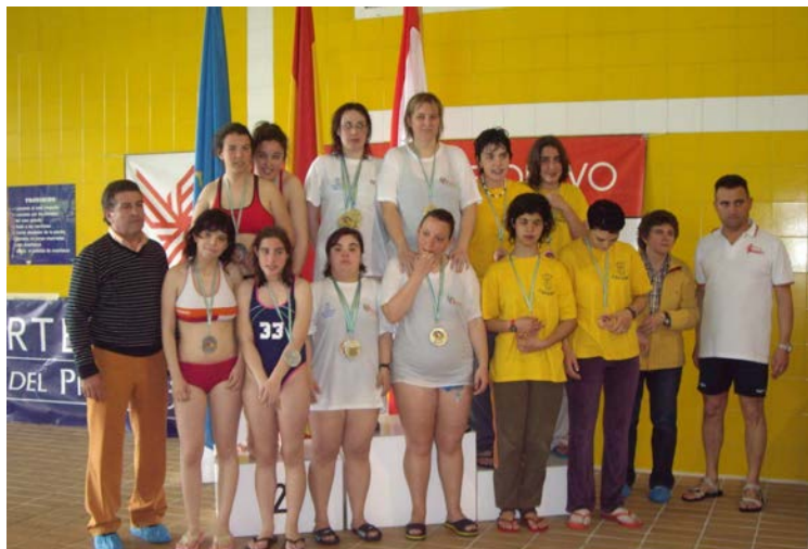
Entrega medallas Juegos Natación (El Llano-Gijón)