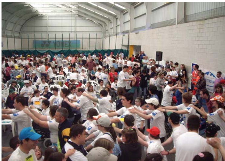
Clausura Juegos Deporte Especial (La Morgal)