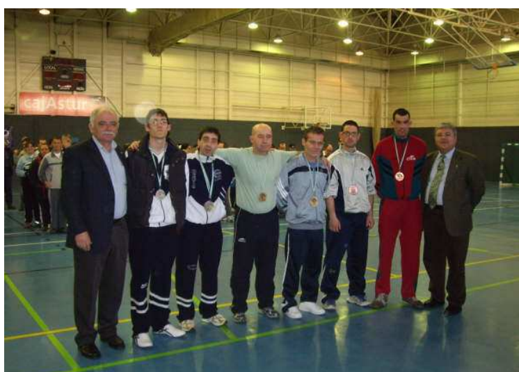
Autoridades entrega premios (La Magdalena-Avilés)