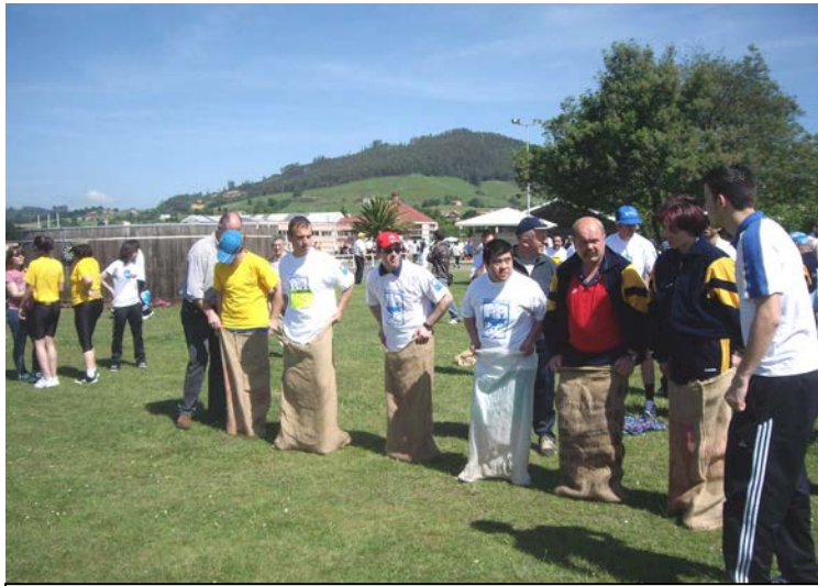
Juegos La Morgal (Carrera sacos)