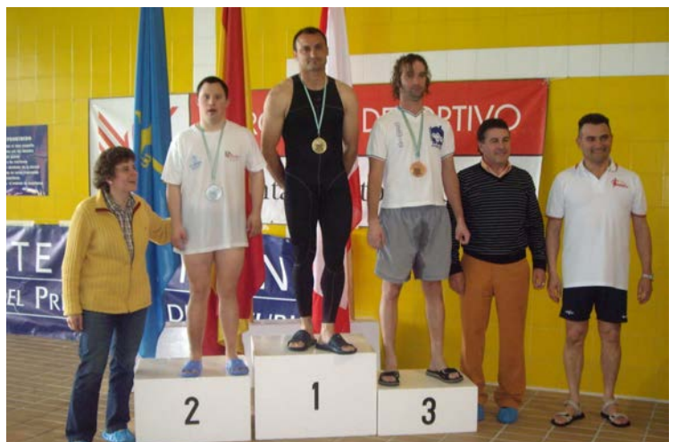
Entrega medallas Juegos Natación (El Llano-Gijón)