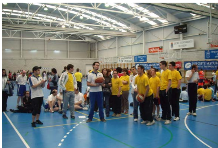
Juegos Tiros Libres (Colloto)