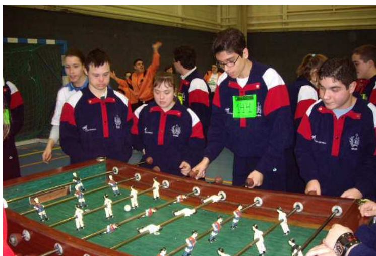
Juegos Futbolín (La Magdalena-Avilés)