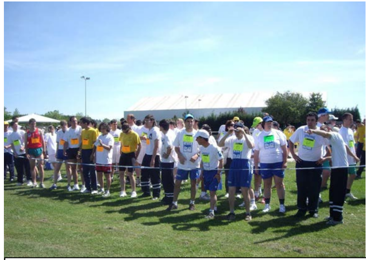
Salida Campo a Través (La Morgal)