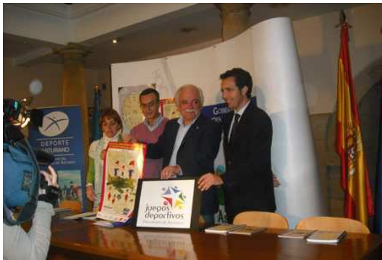
Presentación Juegos Deporte Especial 2008-2009