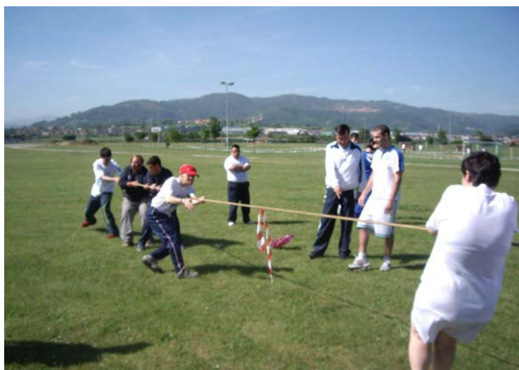
Juegos La Morgal (Tira-soga)