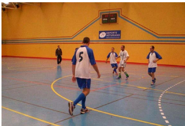
Juegos Fútbol-Sala (El Cristo-Oviedo)