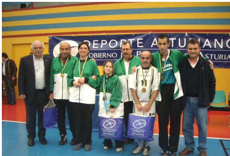
Intercambio con Extremadura. Juegos Fútbol-Sala