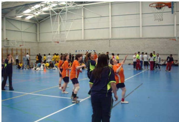
Juegos Baloncesto (Colloto)