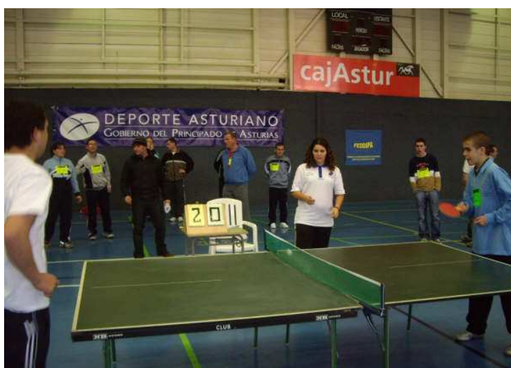
Juegos Tenis Mesa (La Magdalena-Avilés)