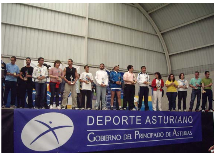
Representantes centros Juegos Deporte Especial