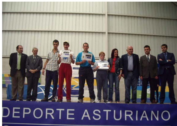
Entrega vale material deportivo 2008-2009