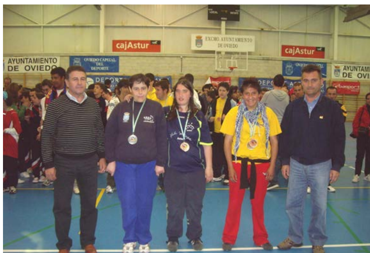
Entrega medallas Juegos Tiros Libres (Colloto)